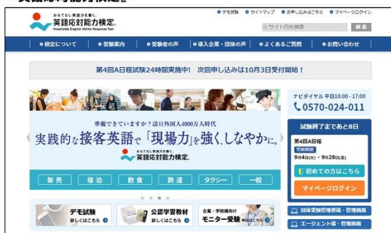
『英語対応能力検定』